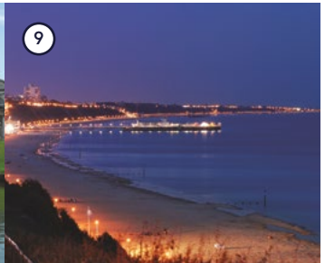
9 Bournemouth Beach Bournemouth