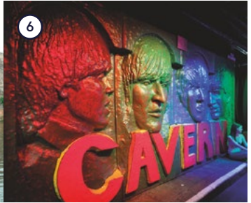
6 Home of The Beatles Liverpool