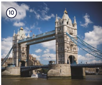
10 Tower Bridge London