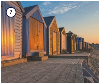
7 Porth Neigwl Abersoch