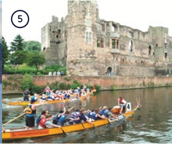
5 Dragon Boat Festival Nottingham