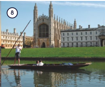
8 Punting on River Cam Cambridge