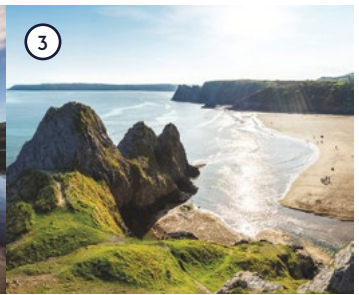
3 Gower Peninsula Swansea