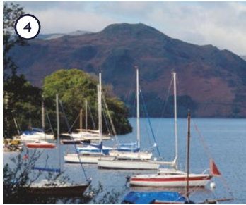
4 Ullswater Lake District