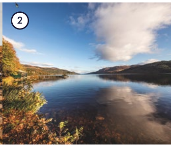
2 Loch Ness Scottish Highlands