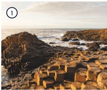
1 Giant's Causeway County Antrim